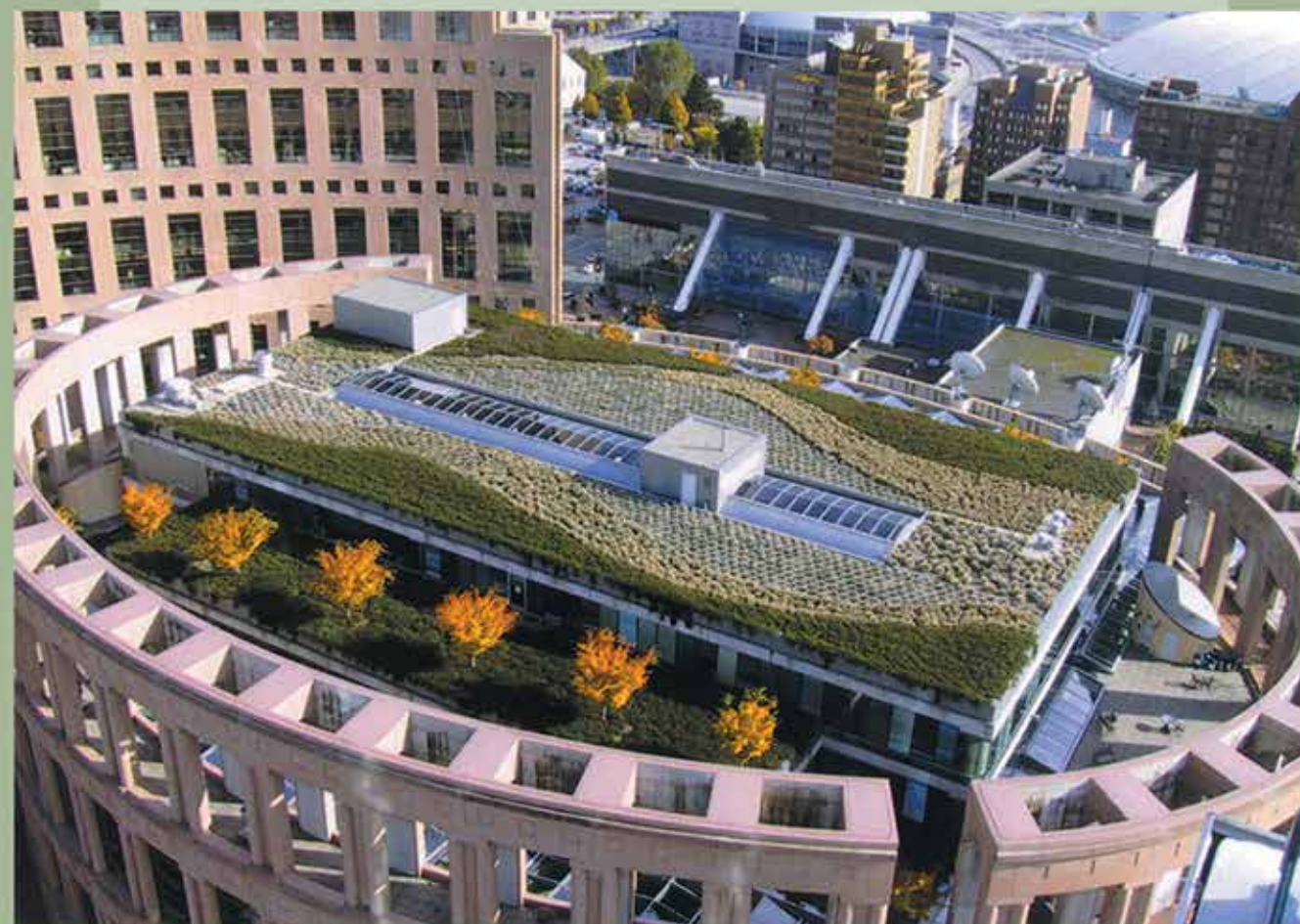
▲ Bibliothèque de Vancouver