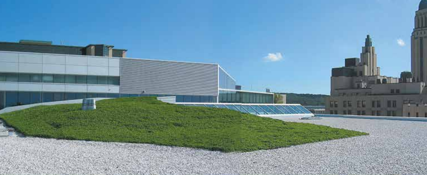
▲ Pavillon Lassonde de l'Université de Montréal